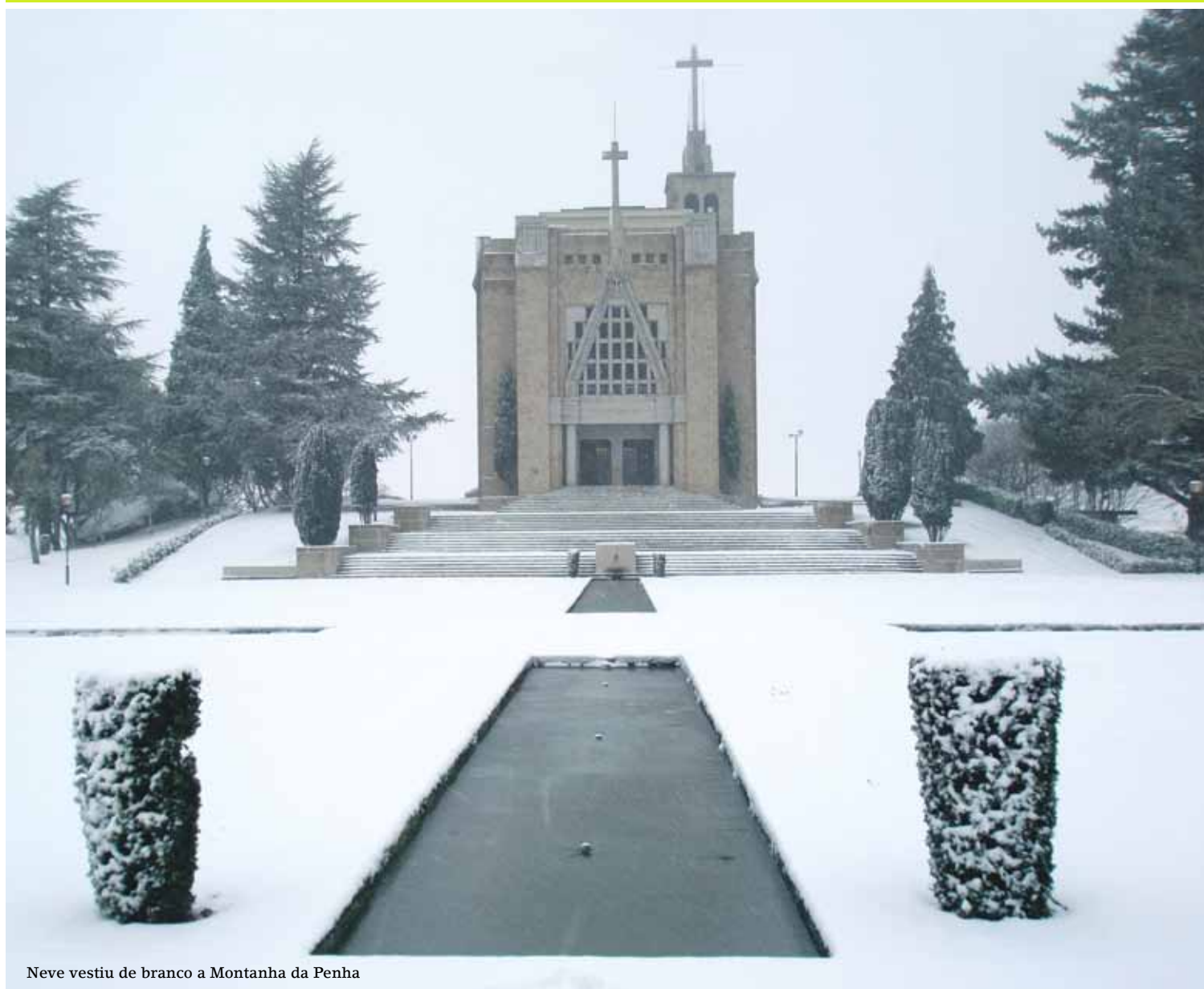
Neve vestiu de branco a Montanha da Penha

Irmandade de Nossa Senhora do Carmo da Penha | Distribuição Gratuita | Fevereiro - Abril 2009