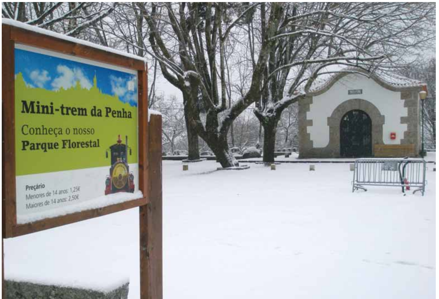
Em 9 de Janeiro de 2009 a neve voltou a cair e pintar de branco a Montanha da Penha